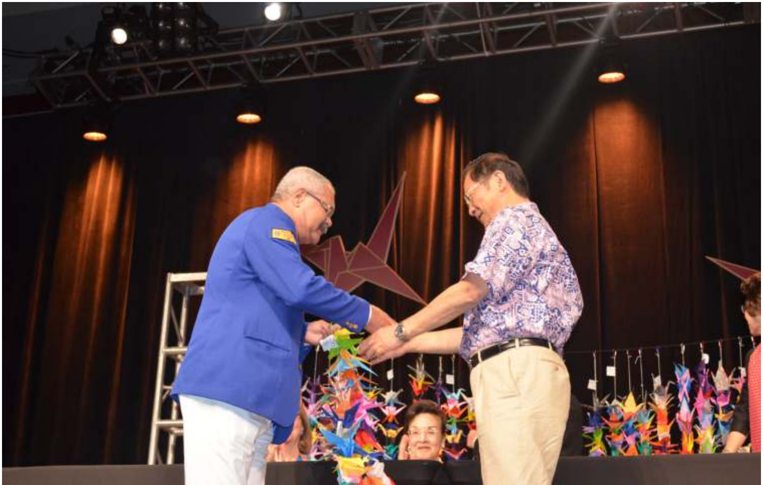
O mundo Leonístico pode vivenciar uma experiência única e memorável, com muitas atividades culturais, artísticas e integração étnica representada por mais de 200 países e áreas geográficas ao redor do mundo. Página 4 e 5