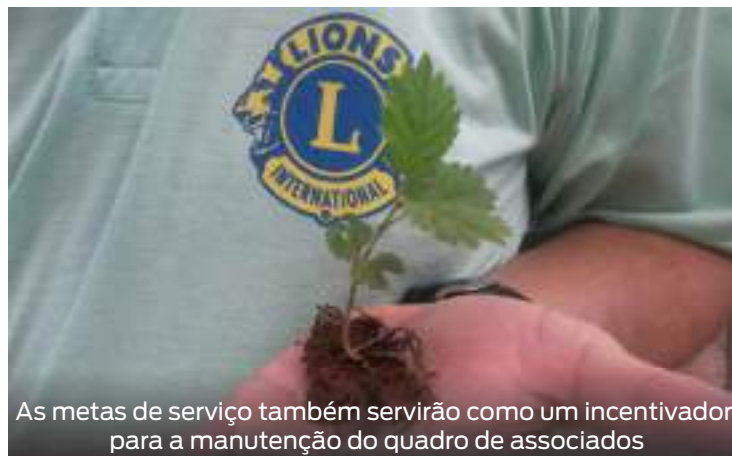
As metas de serviço também servirão como um incentivador para a manutenção do quadro de associados

Para o meio ambiente, o DG solicita aos clubes que elaborem um projeto de plantio de mínimo 500 mudas de árvores, entre os dias 21 e 24 de setembro (Semana da Árvore). Nesse serviço, além da parceria com o poder público, para a cessão